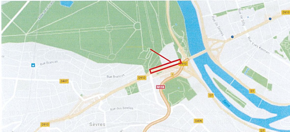
Plan de situation du projet

Le présent projet, situé à Sèvres et à Saint-Cloud, part du pont de Sèvres à l'Est pour rejoindre l'avenue de la division (RD 406) à l'Ouest, vers le centre-Ville de Sèvres.