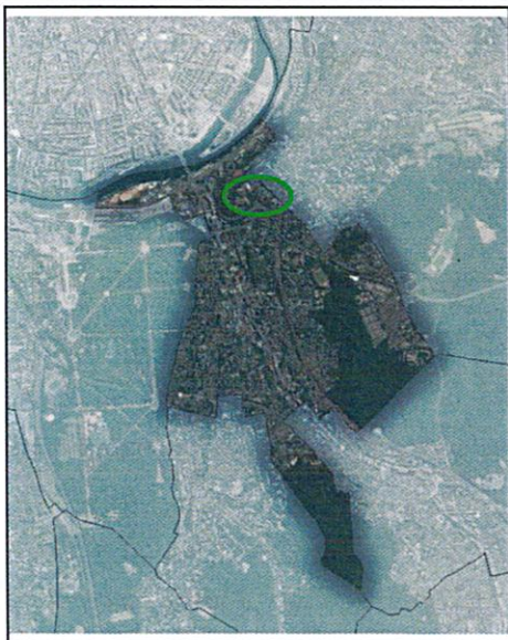
ANNEXE 2 - Périmètre de veille dit « CTIF et environs » référencé à l'article 4