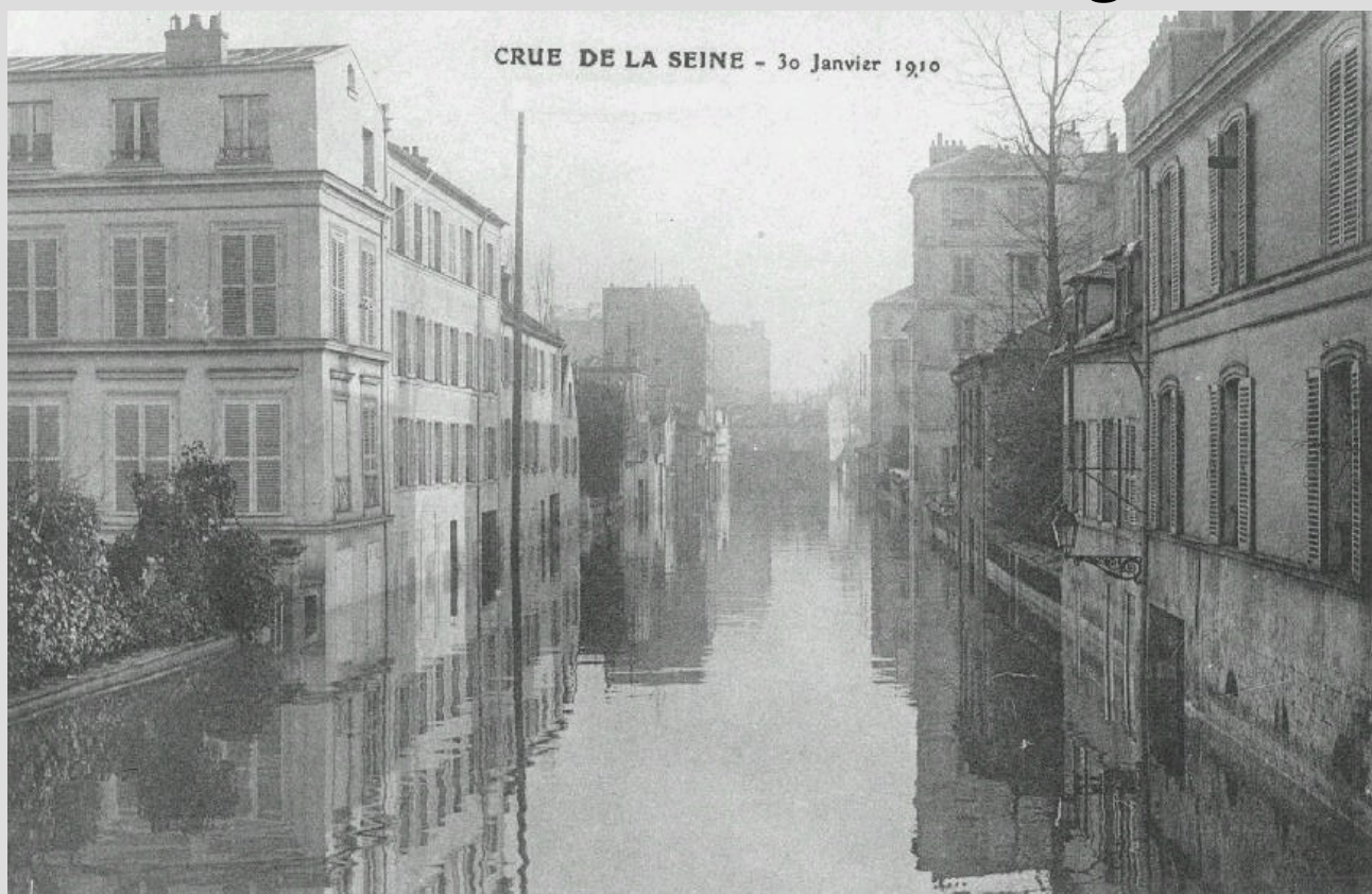
Inondations Janvier 1910