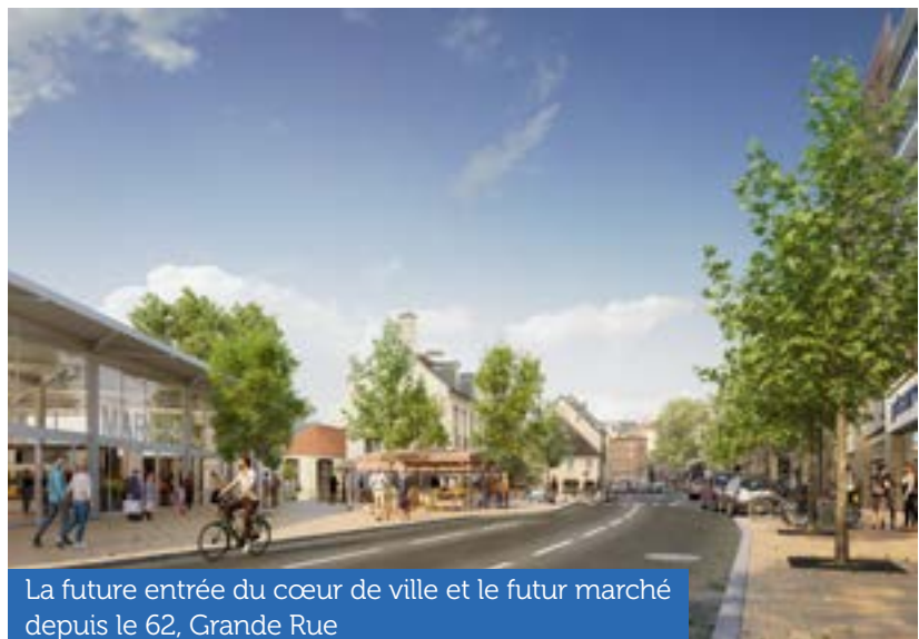
La future entrée du cœur de ville et le futur marché depuis le 62, Grande Rue

place de la station BP, entre la mairie et l'église, en face du parking du Théâtre. Ce nouveau marché sera accessible tant par l'avenue de l'Europe que par la Grande Rue. Une nouvelle perspective sera créée grâce à la démolition du pont du 8 mai 1945.