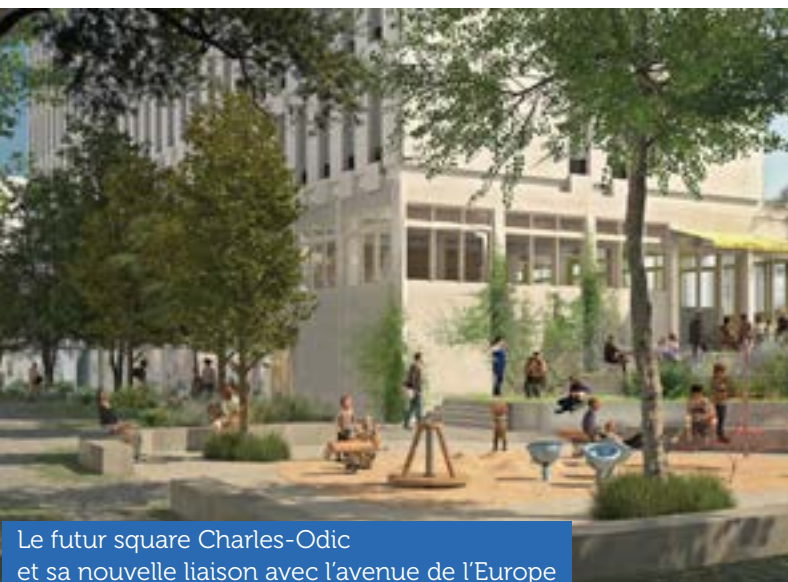
Le futur square Charles-Odic et sa nouvelle liaison avec l'avenue de l'Europe