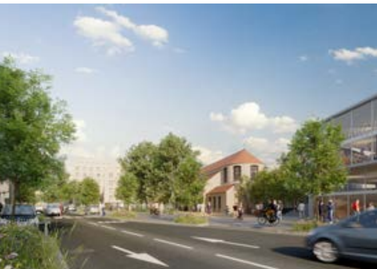
La future entrée du cœur ville depuis le 5, avenue de l'Europe