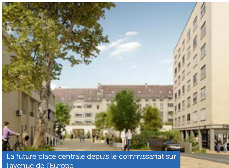
La future place centrale depuis le commissariat sur l'avenue de l'Europe