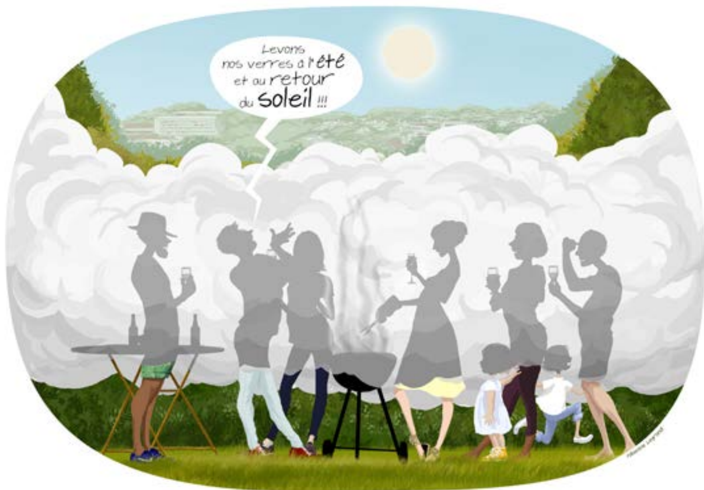
Dessin d'humour de Fabienne Legrand